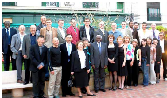
Le président Diack en compagnie des congressistes de la Conférence de consensus nutritionnel de l'IAAF

"Cette Déclaration de consensus est un document important pour notre discipline, a commenté le président Lamine Diack. Non seulement, il s'agit d'une aide précieuse pour définir et guider les besoins nutritionnels des athlètes de haut niveau, mais en plus, il encourage des habitudes alimentaires bonnes et saines. Je recommande fortement à tous les athlètes et à leur entourage de lire à la fois cette Déclaration de consensus et les ouvrages de sensibilisation disponibles."