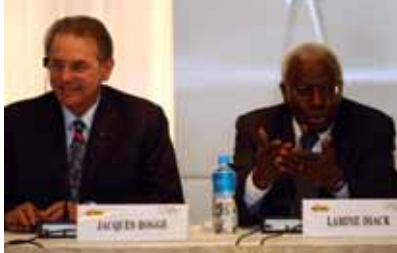
24 août : Jacques Rogge et Lamine Diack