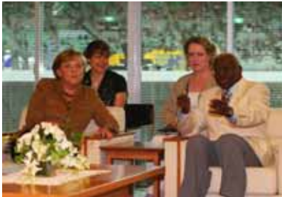
31 août : la Chancelière allemande Angela Merkel reçue par Lamine Diack