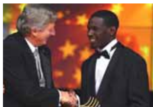
Dick Fosbury et Donald Thomas