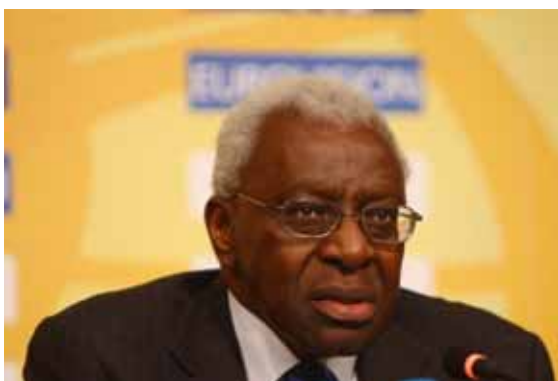
Le président Lamine Diack lors de la conférence de presse de l'IAAF à Osaka.

Mais par dessus tout, il y a eu tellement de compétitions relevées et de dénouements serrés que les téléspectateurs du monde entier ont pu avoir un aperçu de l'intensité dramatique et de l'enthousiasme qui sont le sel de l'athlétisme de très haut niveau.