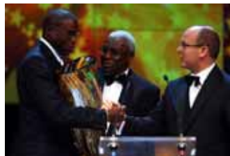
Carl Lewis, Lamine Diack, le Prince Albert