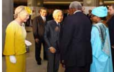
25 août : l'Impératrice Michiko et l'Empereur Akihito rencontrent Lamine Diack