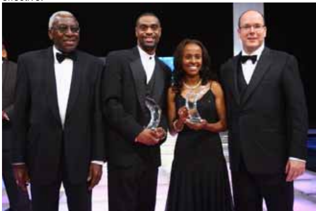
Gala de l'Athlétisme mondial – SAS le Prince Albert II de Monaco (à droite) et Lamine Diack, Président de l'IAAF, entourent Tyson Gay et Meseret Defar, Athlètes mondiaux 2007.

Au fur et à mesure de l'élaboration et de la mise en œuvre du Plan Mondial pour l'Athlétisme, de nombreux domaines qui nécessitent une action énergique ont été identifiés et bien souvent des solutions ont été avancées. Il nous appartient aujourd'hui de bâtir sur ces acquis, de trouver les moyens humains et les stratégies nécessaires à leur mise en œuvre effective.