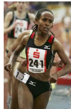
Defar : record du Monde du 3000m à Stuttgart

Précédent: 4,91m Yelena Isinbayeva RUS, Donetsk, UKR, 12 fév. 06