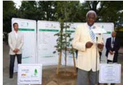
31 août : Lamine Diack participe à la plantation d'un arbre dans le cadre du Projet vert de l'IAAF