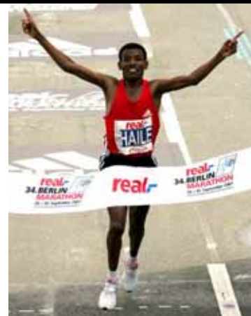
Gebrselassie termine en 2h04'26 à Berlin