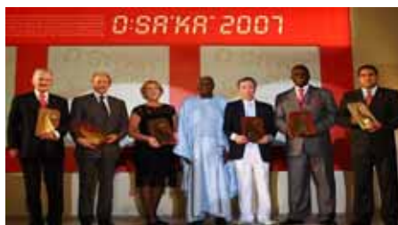
Le président Diack en compagnie des récipiendaires de la Plaque du Mérite