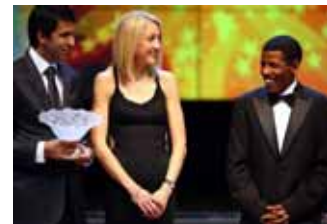
El Guerrouj, Radcliffe et Gebrselassie