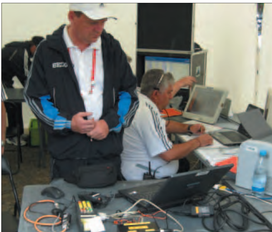
Secrétaires aux Championnats du Monde de Berlin 2009.

La Fiche Récapitulative de Jugement est le document officiel de la course. Il est donc important qu'elle soit PRÉCISE. A la fin de la course, les cartes individuelles de jugement de chaque Juge sont collectées et tous les avertissements et cartons rouges sont ajoutés sur la Fiche Récapitulative de Jugement. Il est important d'indiquer l'heure à laquelle chaque carton rouge a été rempli et l'heure à laquelle la disqualification d'un compétiteur a été appliquée. L'équipe de Juges doit recevoir une copie de la Fiche Récapitulative de Jugement. De plus, cette Fiche doit être