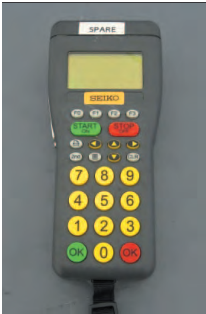
Terminal portable des juges.