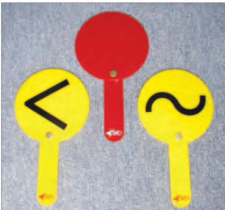
Palettes de mise en garde (Jaunes) et de disqualification (Rouge)