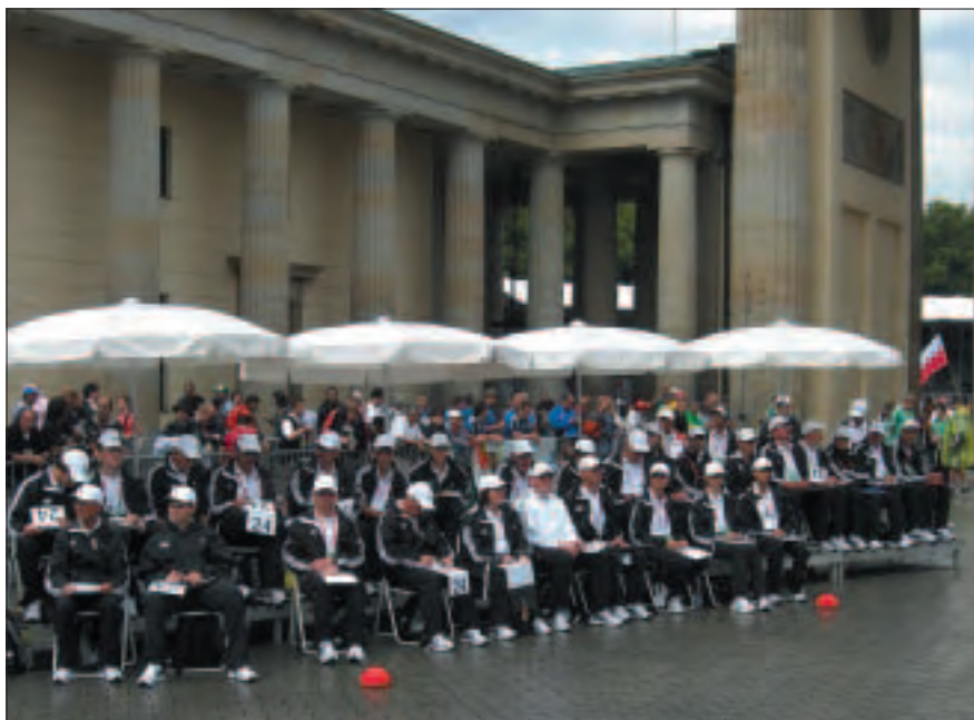
Pointeurs aux Championnats du Monde de Berlin 2009.

L'IAAF sélectionne les Juges pour les compétitions régies par la Règle 1.1(a) de l'IAAF à partir de la Liste des Juges Internationaux. Leurs fonctions, comme celles du Secrétaire, sont décrites dans le paragraphe sur le jugement de ce manuel.