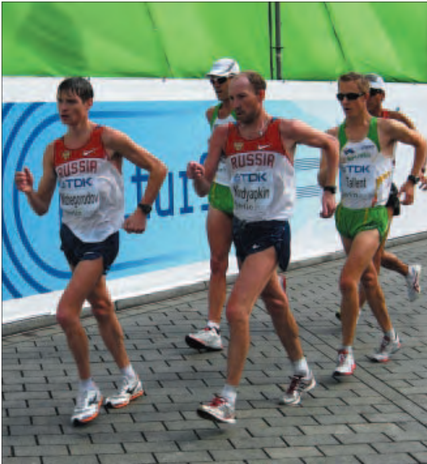
Groupe de tête aux 50km aux Championnat du Monde, Berlin 2009.

iv. Le service des résultats reçoit l'information validée.