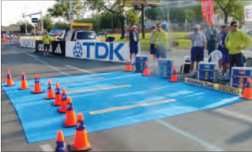
Tapis pour le système de transpondeur.