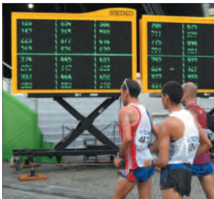
Tableau de report des cartons rouges, Berlin 2009.