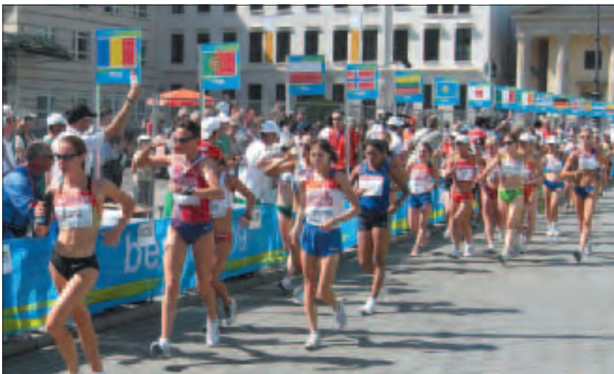
Poste de rafraîchissement aux Championnats du Monde de Berlin 2009.

d'avoir des éponges de taille moyenne trempées dans des seaux d'eau et placées sur des tables de 1m de haut pour être d'accès facile pour les marcheurs. Selon la règle 230.9, les ravitaillements, qui peuvent être fournis par le Comité d'Organisation ou par les athlètes, seront placés sur des tables identifiées avec le nom du pays des athlètes (ou les 3 lettres code). Ils seront placés de façon à être d'accès facile, ou ils peuvent être mis dans les mains des concurrents par un personnel autorisé. Des officiels d'athlétisme devraient être désignés pour superviser les postes de ravitaillement et s'assurer qu'au maximum deux personnes de chaque pays sont placées derrière chaque table de ravitaillement. En aucun cas une personne n'est autorisée à courir à côté des marcheurs pour donner le ravitaillement. Le personnel doit faire attention de ne pas gêner les marcheurs lorsqu'il ramasse les bidons etc. jetés sur le parcours.