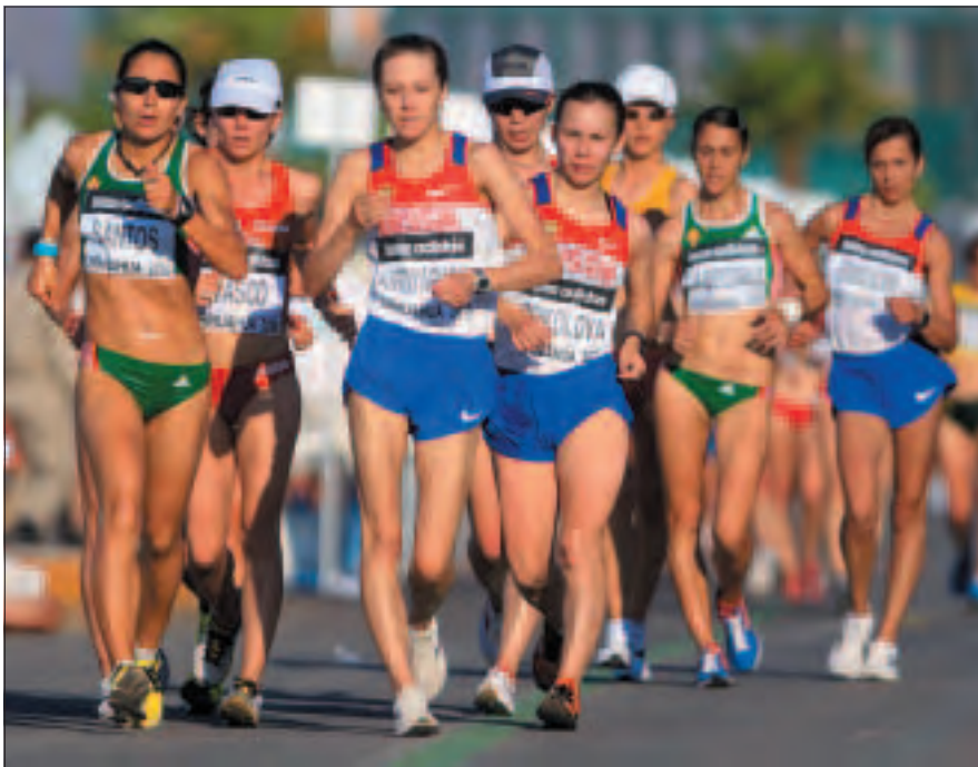
20km femme de la Coupe du Monde 2010.