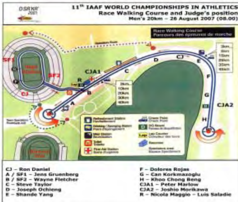
Plan du Circuit et positions des juges sur route. Championnats du Monde d'Athlétisme d'Osaka, 2007.