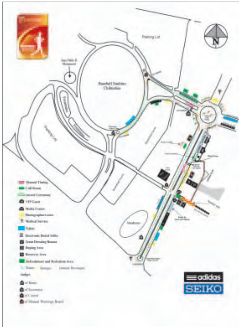
Plan de circuit de la Coupe du Monde de Marche IAAF, Chihuahua 2010.