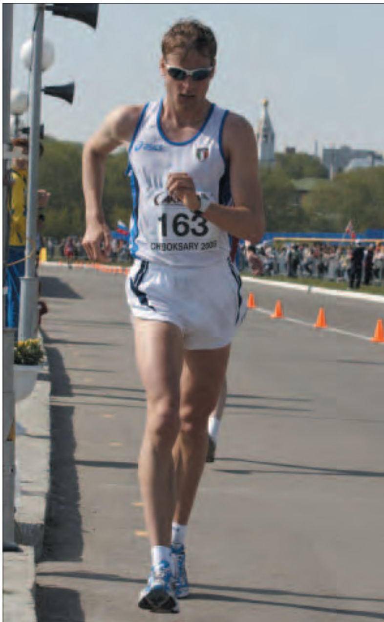
Alex Schwazer, Champion Olympique 2008