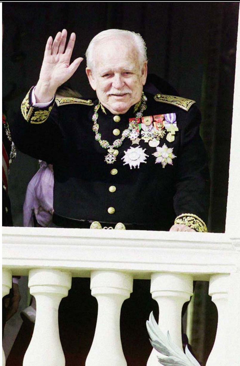
S.A.S. Le Prince Rainier III de Monaco