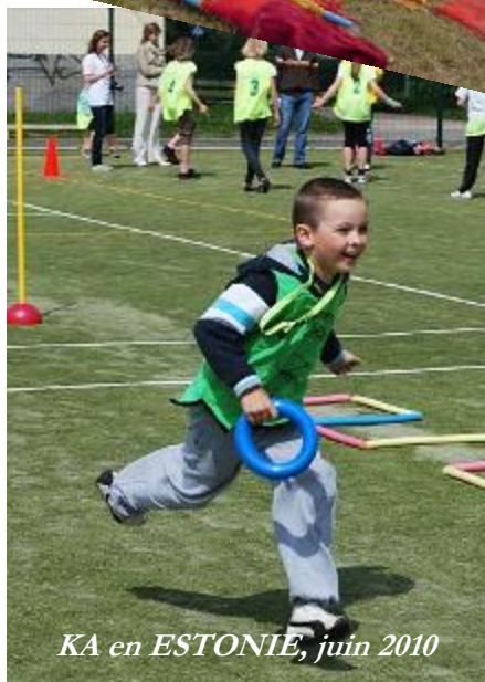
KA en ESTONIE, juin 2010

Pour toute information concernant ce bulletin, merci de contacter :