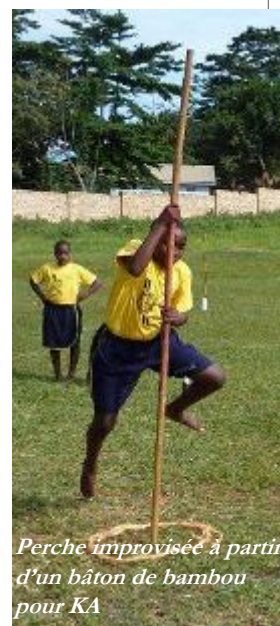
Perche improvisée à partir d'un bâton de bambou pour KA

Enfin, le programme KA a même été intégré au plan d'action de la Fédération ougandaise pour l'éducation et la détection de talents.