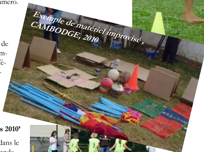
Exemple de matériel improvisé, CAMBODGE, 2010