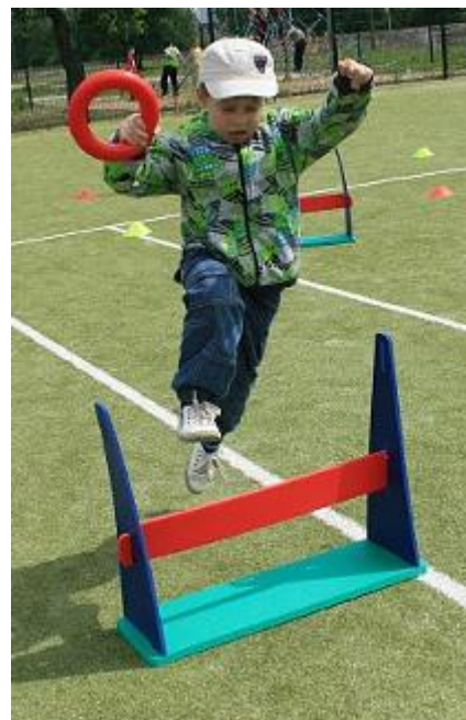
Photo: Epreuve de course de haies durant la Compétition KA (juin 2010).

http://picasaweb.google.ru/vpredbannikov/Olumpiamangud#