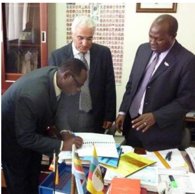
Le Président de l'UAF signant la Convention en présence du Ministre de l'Éducation et des Sports

tics qui a rassemblé 48 enfants. Les conférenciers fraîchement formés doivent à présent transmettre à leur tour leurs connaissances aux enseignants d'EPS chargés de mettre en place le programme KA dans chacune des écoles de leurs provinces.