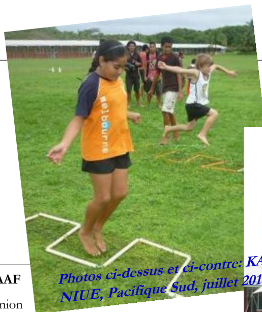
Photos ci-dessus et ci-contre: KA à NIUE, Pacifique Sud, juillet 2010

Œuvrant pour le bien-être des enfants des pays difficiles (en guerre, post guerre ou victimes de catastrophes naturelles), cette Organisation a signé une Convention avec l'IAAF pour faire bénéficier ces enfants de Kids' Athletics. Une première action a été menée en Haïti en coopération avec l'IAAF qui a fait don de 10 kits Kids' Athletics. L'IAAF a aussi accepté de subventionner un stage de formation pour Instructeurs KA.