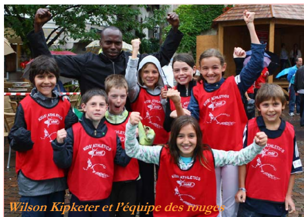
Wilson Kipketer et l'équipe des rouges

Les participants et les Ambassadeurs de l'IAAF à la fin de la compétition KA