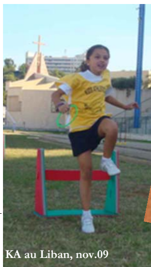
KA au Liban, nov.09

Toute l'équipe du « Programme des Jeunes de l'IAAF » vous souhaite de BONNES FETES et vous donne rendez-vous en 2010 dans de nouvelles éditions.