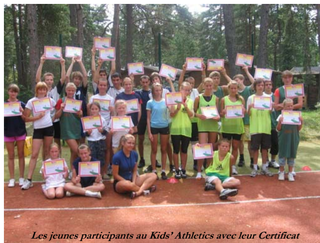
Les jeunes participants au Kids' Athletics avec leur Certificat

programme Ecoles & Jeunes de l'IAAF pour les enseignants d'EPS et les entraîneurs. Le premier module était planifié pour le 7 novembre 2009 et un séminaire a déjà été organisé dans la ville de Kohtla-Järve pour les enseignants. L'objectif de ce séminaire