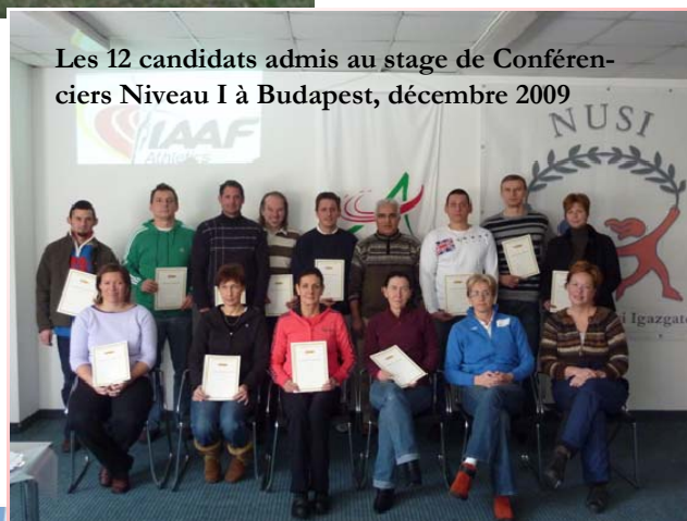
Les 12 candidats admis au stage de Conférenciers Niveau I à Budapest, décembre 2009