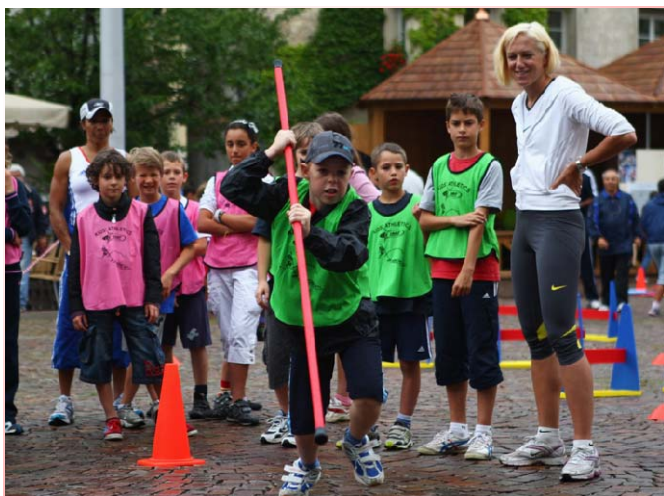
Kajsa Bergqvist encourage son équipe à l'épreuve de la perche.

blement insufflé leur passion pour l'athlétisme à ces jeunes. La pluie qui s'était abattue quelques minutes avant la rencontre, n'a pas ébranlé le moral des enfants: ils se sont vraiment amusés sur les différents ateliers.