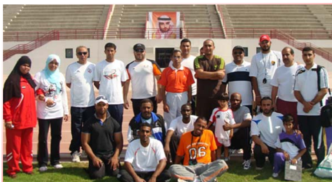
The group of participants before the practical session

adaptée et originale. Le stage comprenait une démonstration de Kids' Athletics à laquelle un jeune Cheikh de la famille princière Al Maktoum de Dubai a participé (comme en témoigne la photo ci-contre).