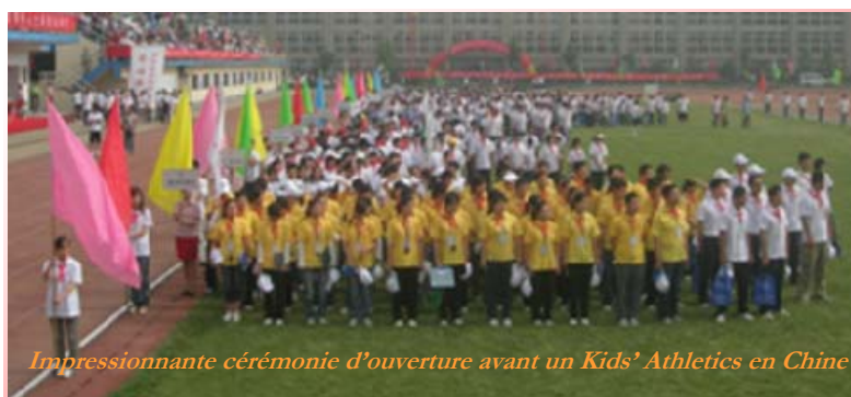
Impressionnante cérémonie d'ouverture avant un Kids' Athletics en Chine