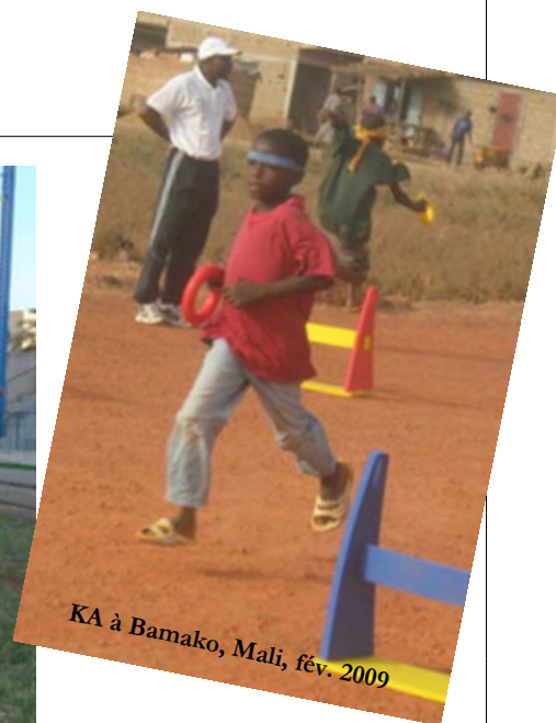
KA à Bamako, Mali, fév. 2009