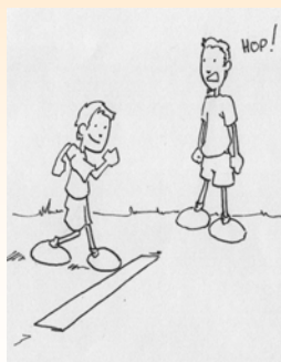
position de départ