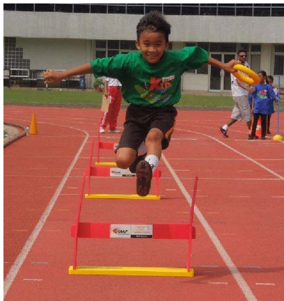
Epreuve Kids' Athletics: la course de haies

Maurice, le Sri Lanka, l'Argentine et le Kenya.