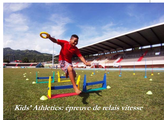
Kids' Athletics: épreuve de relais vitesse

Ces FM ont toutes consacré un budget pour la formation des entraîneurs et les lauréats travailleront pour le développement de l'athlétisme des jeunes.