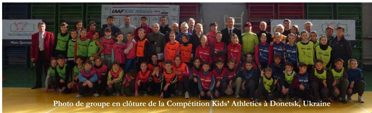
Photo de groupe en clôture de la Compétition Kids' Athletics à Donetsk, Ukraine

Donetsk, Ukraine - Le coup d'envoi des stages de formation pour Conférenciers Kids' Athletics IAAF / Nestlé, a été donné à Donetsk, Ukraine , du 9 au 12 février avec une activité qui a rassemblé 22 entraîneurs et enseignants d'EPS représentant toutes les régions d'Ukraine, et parmi eux, Iryna Lishchynska, médaille d'argent olympique au 1500m à Beijing.